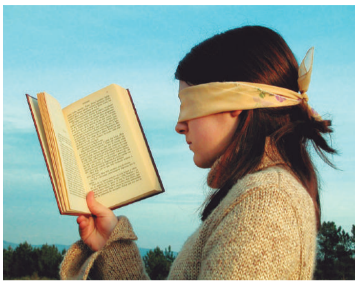
O analfabetismo está em queda na maioria dos municípios do Paraná

Quatro Pontes, na região Oeste, é a vice-líder com 1,6% de analfabetos, seguida por Maringá, no Noroeste, com 2%. Rio Negro, na região Sul, e Pinhais, na Região Metropolitana de Curitiba, completam o top 5 dos municípios com melhores índices no Estado ambas com uma proporção de 2,2% de analfabetos entre a população. No total, são 16 municípios com índices inferiores a 2%. Completam a lista Londrina, Mallet, Nova Santa Rosa, Araucária, Pato Branco, Paranaíba, Piên, Fazenda Rio Grande, União da Vitória, São José dos Pinhais