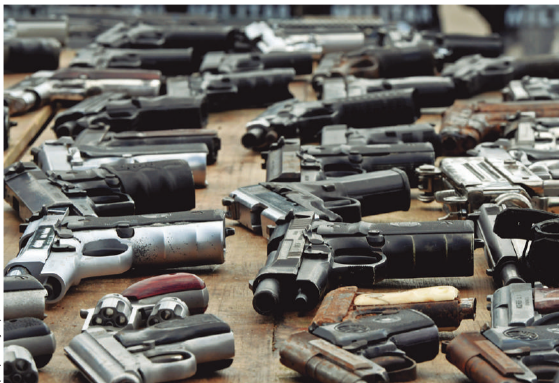
Comissão de Segurança Pública aprovou projeto de lei que abre prazo para o recadastramento de armas

O projeto tramita em caráter conclusivo e ainda será analisado pela Comissão de Constituição e Justiça e de Cidadania. (Agência Câmara de Notícias)