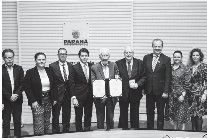
A cerimônia de assinatura, ontem em Curitiba

A escolha da empresa se deu após um chamamento público, que teve como vencedor o consórcio das empresas Astra Medical Supply e Nucitec. Além da instalação da indústria para produção nacional das fórmulas de nutrição clínica especializada, a