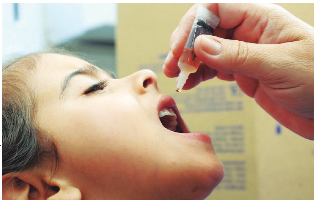
Campanha de vacinação contra a poliomielite começa em todo o Paraná

No Paraná, a expectativa é que 717.915 crianças menores de cinco anos recebam a dose. Aquelas menores de um ano (139.732) deverão ser