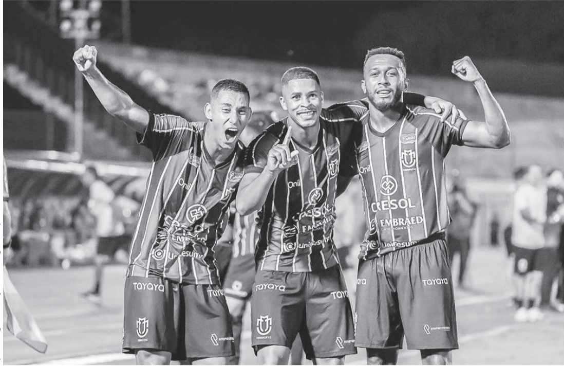
Time maringaense encara mineiros com foco em manter invencibilidade em jogos no estádio municipal