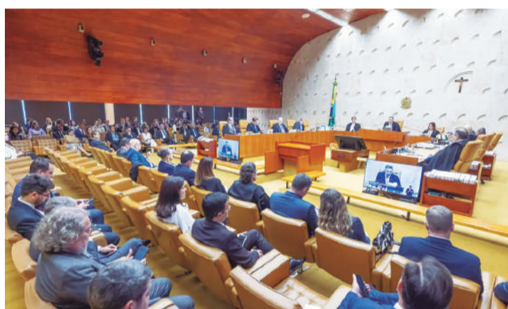
Ministros reconhecem abusos contra a liberdade de imprensa no país

O Plenário do Supremo Tribunal Federal (STF) reconheceu como assédio judicial o ajuizamento de inúmeras ações simultâneas sobre os mesmos fatos, em locais diferentes, para constranger jornalistas ou órgãos de imprensa e dificultar ou encarecer a sua defesa. No entendimento do colegiado, a prática é abusiva e compromete a liberdade de expressão.