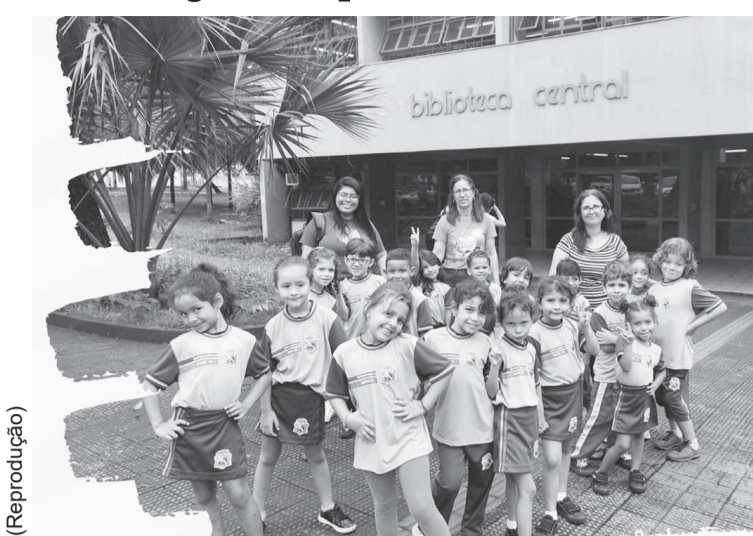
Prefeitura cria plano para proteção nos estabelecimentos escolares

Dentre as ações elencadas para atacar a raiz de problemas estão: manutenção dos vigilantes do quadro próprio de funcionários nas unidades da rede municipal; presença ostensiva da equipe da Po-