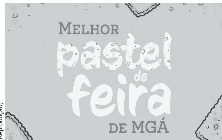
O vencedor do concurso 'Melhor Pastel de Feira de Maringá' será divulgado em 7 de junho