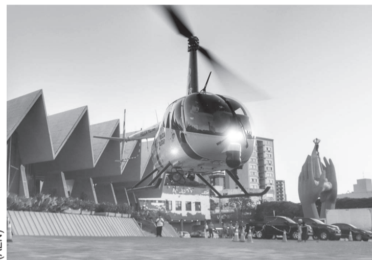
O esquema de segurança preventiva em cidades do Oeste do Paraná terá até helicóptero

A operação visa intensificar o policiamento ostensivo em Cascavel, na região Oeste do Estado. O reforço no policiamento também alcançará Medianeira, Toledo e Marechal Cândido Rondon e brevemente outras cidades do Estado, inclusive Maringá. A operação conta com mais de duzentos homens e mulheres e cinquenta viaturas, além de um helicóptero. Os policiais civis e militares atuarão em diversos pontos das cidades para promover maior segurança com ações preventivas e repressivas, utilizando patrulhamento aéreo e terrestre, com cães policiais, bloqueios de trânsito, abordagens e fiscalizações de veículos e pessoas. Toda a atividade da Operação Vida Cidade Segura será acompanhada