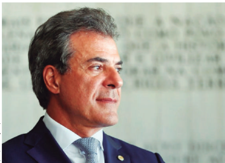
Com a anulação de condenações impostas nos últimos dez anos, alvos famosos da operação traçam estratégias para voltar à cena

Inicialmente, os ministros tinham decidido que a vedação valeria para casos de crimes sexuais. Mas, ao final do julgamento, os ministros decidiram estender para todos os crimes de violência contra a mulher – os delitos previstos na Lei Maria da Penha e a violência política de gênero, por exemplo. (Agência Brasil)