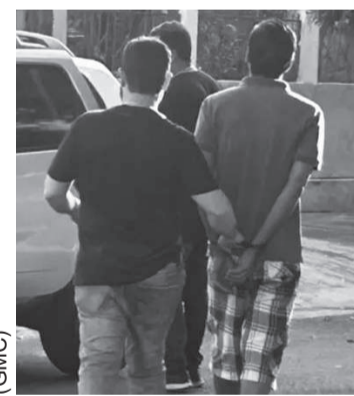
O padrasto acusado de estuprar as enteadas foi preso ontem

As vítimas eram duas meninas, uma de 3 e outra de 7 anos. A mãe confirmou no Núcleo de Maringá que ela e a irmãzinha eram abusadas pelo companheiro da sua mãe. O homem, de 44 anos, foi preso em flagrante na tarde de quarta-feira, após ser denunciado pela própria companheira, que o flagrou tocando nas partes íntimas da filha mais nova. Segundo a mãe das meninas, a filha mais ve-