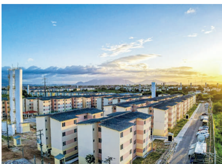
Em todo o país, 1,4 milhão de unidades foram concluídas desde a retomada do programa

Paralelamente às entregas, o Governo do Brasil tinha como compromisso a contratação de duas milhões de novas unidades na atual gestão, com