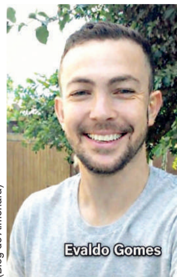
(Blog do Almenara)

O barbeiro era o alvo do atirador, que matou também o cliente