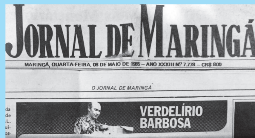
Coluna do Verdelírio Barbosa em maio de 1985