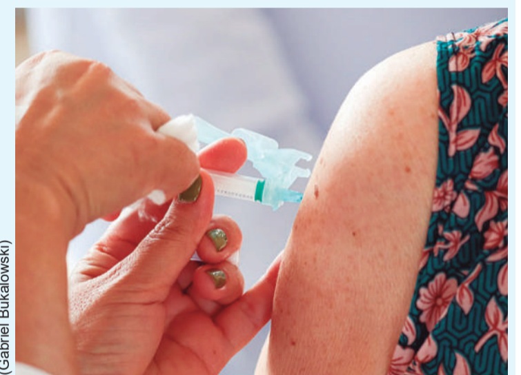
Foram aplicadas 675 doses da vacina no primeiro dia da campanha

força que a vacinação é a principal forma de prevenção contra casos graves de gripe, especialmente com a aproximação do inverno. (Da Redação)