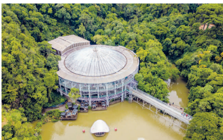
O Estado foi o vencedor de uma das categorias que disputou no M&E Awards

sileiros disputaram 12 categorias (alguns concorrendo em mais de uma seção). O Paraná e os demais vencedores vão receber seus troféus durante solenidade na feira WTM Latin América, em São Paulo (SP), no dia 14 de abril. “É a consagração de um trabalho que tem sido desenvolvido com estratégia, promovendo nossa qualidade e impactando com os nossos