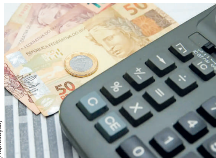
O déficit primário ocorre quando as despesas superam as receitas

O desempenho também veio melhor que o esperado pelo mercado, indicando algum alívio nas contas públicas no curto prazo. A pesquisa Prisma Fiscal, sondagem com instituições finan-