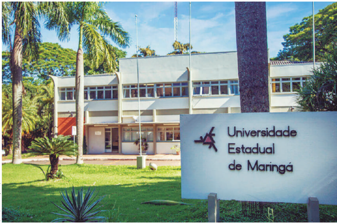
Universidade Estadual de Maringá (UEM) é a 16ª universidade mais empreendedora do Brasil

Na sequência aparecem a Universidade Tecnológica Federal do Paraná (UTFPR), na 19ª colocação, e a Universidade Federal do Paraná (UFPR), em 20º lugar. Já a Universidade Estadual de Londrina (UEL) e a Universidade Estadual de Ponta Grossa (UEPG)