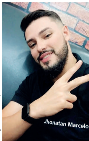
(Blog do Almenara)

Conforme a autoridade policial, o suspeito não falou sobre a motivação do duplo homicídio no depoimento oficial, no entanto, em conversas preliminares com agentes, teria dito que foi um crime de vingança, porque o barbeiro estaria