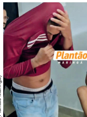
O suspeito confessou o crime, porém optou pelo silêncio no depoimento