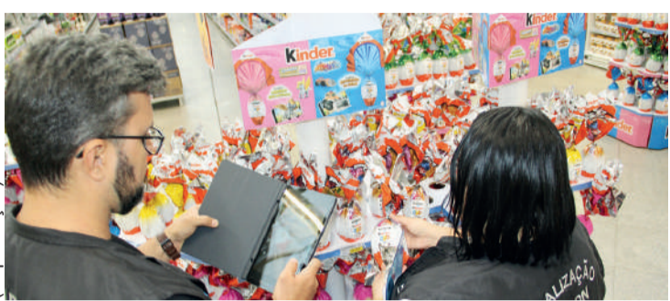
Com o objetivo de informar o consumidor, o Procon realizou uma pesquisa de preços de ovos de Páscoa, bombons e barras de chocolate

A barra Nestle Galak, de 80 gramas apresentou uma variação de 92,96%, sendo