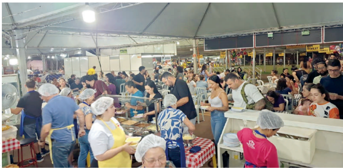
O evento acontecerá do dia 10 a 19 de abril

A edição de 2026 contará com a participação de 10 entidades assistenciais responsáveis pelas barracas gastronômicas, cujo recurso arrecadado será destinado à manutenção de suas atividades, reforçando o caráter solidário