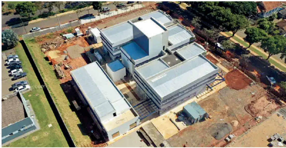
O levantamento tem caráter preventivo e orientativo

O estudo posiciona Maringá na 25ª colocação entre os municípios avaliados, com índice médio