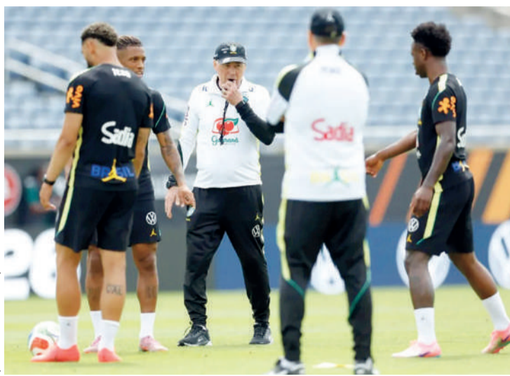
Carlo Ancelotti não confirma nomes, mas indica que time diferente vai enfrentar croatas na noite desta terça-feira nos EUA

to da seleção antes da convocação final do técnico Carlo Ancelotti para a Mundial dos EUA, Canadá e México, que será anunciada no dia 18 de maio.