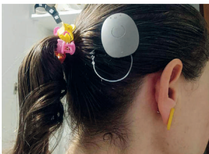
Os procedimentos, assim como todo o tratamento, são oferecidos de forma gratuita pelo SUS

“Temos na Sesa em funcionamento a Linha de Atenção à Saúde da Pessoa com Deficiência, que