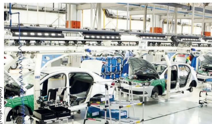
Setor registrou segundo crescimento consecutivo