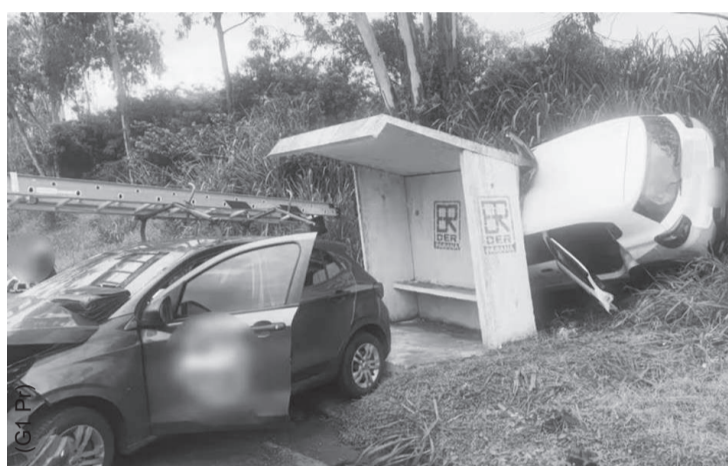
A idosa morta viajava para fazer tratamento médico

Uma idosa de Porecatu que estava sendo levada para tratamento médico em Londrina. Outras duas pessoas, entre elas uma mulher grávida, estavam no banco traseiro do veículo da Prefeitura e sofreram ferimentos generalizados.