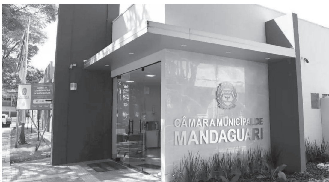
O benefício começa a vigorar a partir de abril

Em justificativa anexada ao projeto, a Câmara afirma que a concessão do auxílio-alimentação “é prática já consolidada na Administração Pública, inclusive em diversas Câmaras Municipais, configurando medida de organização ad-