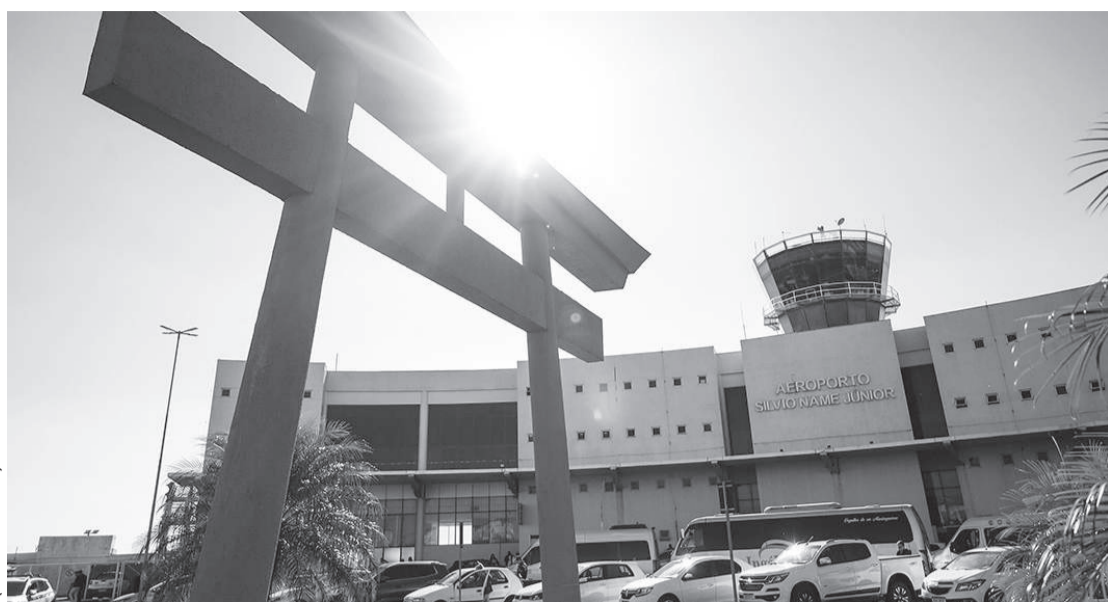
O aeroporto de Maringá espera 10.500 passageiros no feriado

A data reúne aspectos religiosos e culturais, sendo marcada por missas, celebrações comunitárias e tradições familiares, como o compartilhamento de almoços especiais e a troca de ovos de chocolate, que representam fertilidade e renovação.