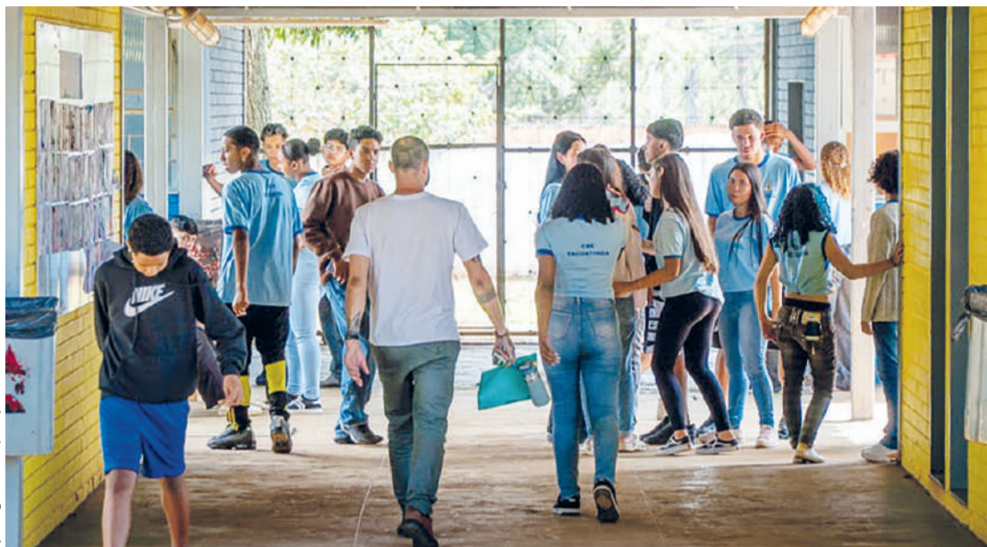
Programa beneficia 202 mil estudantes no Estado

O perfil dos participantes do Pé-de-Meia reforça seu caráter de inclusão e equidade educacional. Voltado