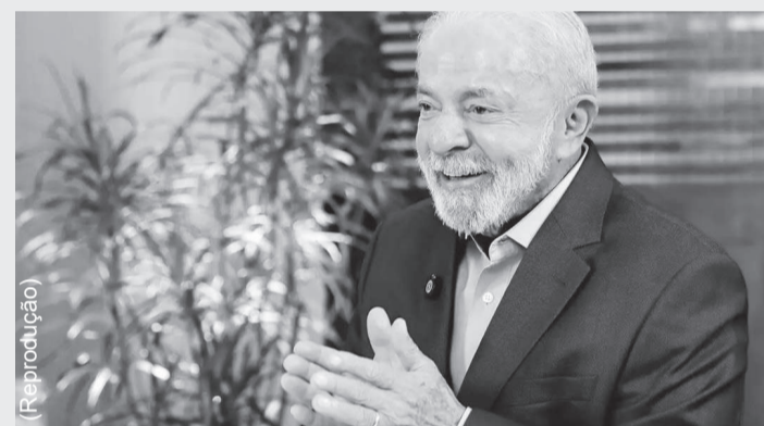
Presidente afirmou que o sistema do BC deve ser aprimorado

O presidente Luiz Inácio Lula da Silva rebateu, nesta quinta-feira (2), críticas ao sistema de pagamentos instantâneos do Brasil, o Pix, feitas em um relatório do Escritório do Representante Comercial dos Estados Unidos. Em evento em Salvador (BA), Lula afirmou que o Pix deve ser aprimorado para atender às necessidades dos brasileiros.