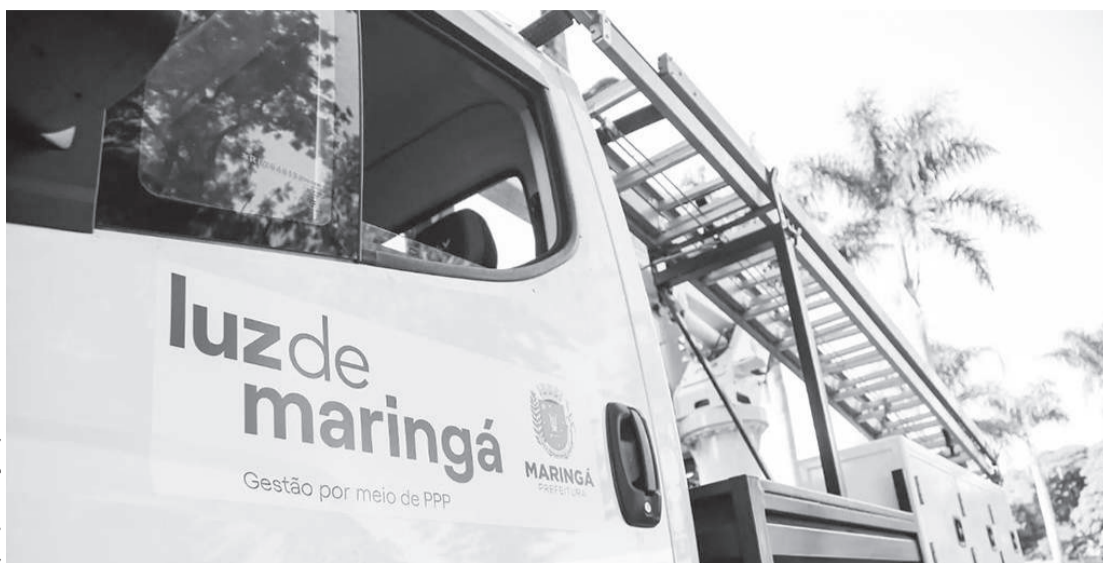
Desde 2025, a Prefeitura vem notificando a empresa e retendo parte dos pagamentos

O contrato da PPP é de R$ 169 milhões, mas até