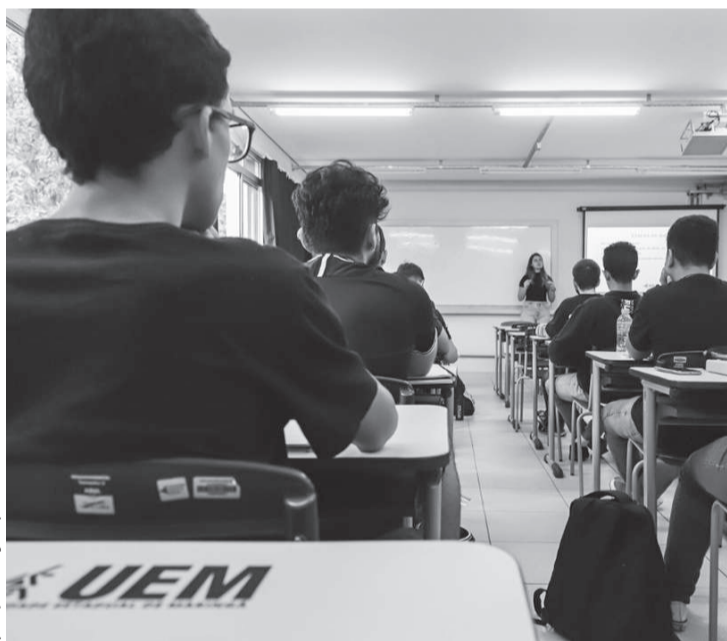
O processo seletivo ofertará 1.123 vagas em mais de 70 cursos de graduação presenciais

Candidatos que desejarem solicitar isenção da taxa poderão fazer o pedido entre os dias 6 e 17 de abril, diretamente no formulário de inscrição. Os critérios e procedi-