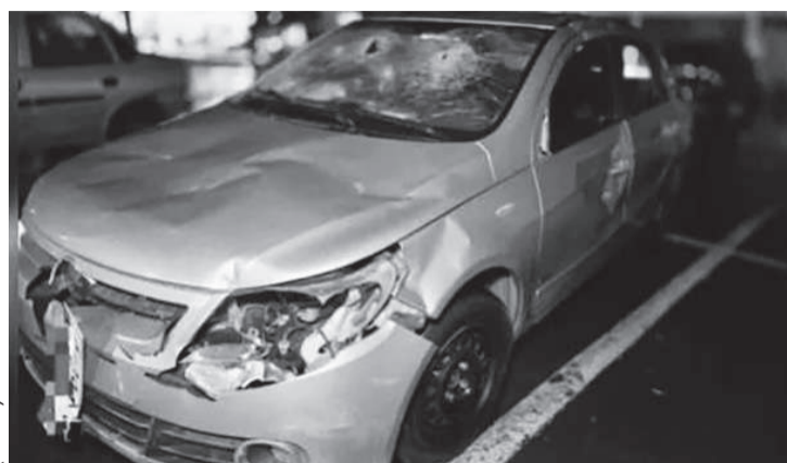
O amante fugiu a pé e deixou o carro que foi danificado a golpes de marreta

A história começou nas redes sociais, envolveu um casal de Maringá e um homem que veio da Bahia sem saber que a mulher que arrebatou seu coração era casada