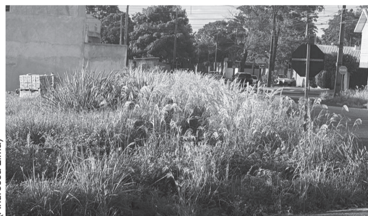
No Jardim Bela Vista, os terrenos sem manutenção impedem os moradores de transitarem pela calçada

A Prefeitura de Maringá reforçou orientações para moradores sobre terrenos e calçadas sujas em áreas privadas. A medida surge após reclamações de moradores, como no Jardim Bela Vista, onde transeuntes enfrentam dificuldades para caminhar devido à falta de manutenção por parte de proprietários ou imobiliárias. Uma moradora relata que, por conta dessa situação, é obrigada a caminhar pela rua.