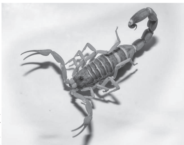
Em 2025, Maringá registrou 1.048 acidentes com escorpiões

Especialistas atribuem o aumento à expansão