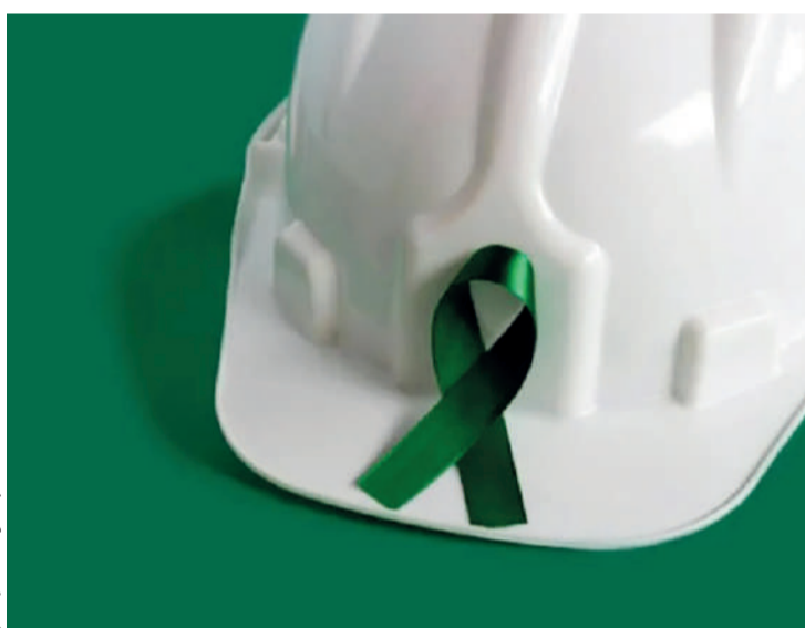
Campanha prevê atividades educativas, treinamentos e divulgação de direitos previstos na legislação trabalhista

O símbolo da campanha é um laço na cor verde e, durante o mês, serão divulgados direitos relativos à Segurança e Medicina do Trabalho, dispostos na legislação e em normas regulamentadoras. A ideia é que órgãos públicos, empresas e instituições realizem palestras, campanhas educativas, inspeções e treinamentos voltados à redução de riscos no trabalho. O objetivo é fortalecer a cultura de prevenção, estimulando o uso de equipamentos de