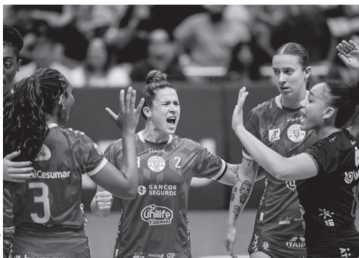
Maringãenses perderam na primeira partida em BH e precisam de triunfo para forçar terceiro jogo